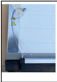
Abb.1: Kabelausgang Innenseite links