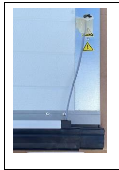
Abb.2: Kabelausgang Innenseite rechts

Ausgang unten am Bodenprofil oder oben am Verstärkungsprofil (Standard)